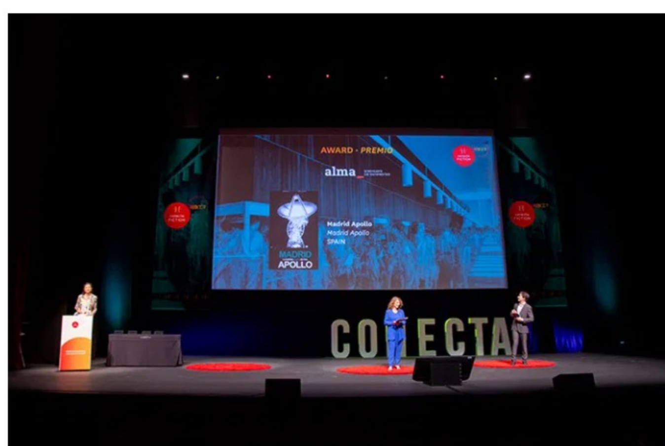
Conecta FICTON 2020.

El foro de coproducción Conecta FICTION ha ampliado el plazo para enviar proyectos a varias de sus sesiones de pitching en 2021, año en que celebra su quinta edición con un formato híbrido.